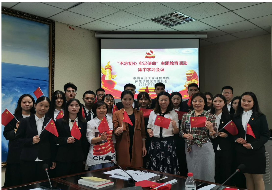
4. 10月1日上午，学院党支部组织留校师生党员、入党积极分子、学生干部集中观看阅兵。