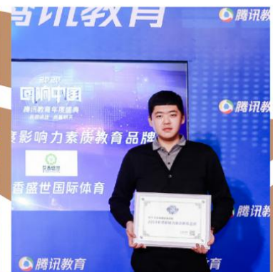
2020回响中国腾讯教育年度盛典 年度影响力素质教育品牌奖项