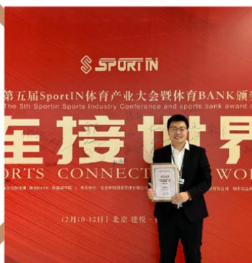
2019体育产业大会暨体育bank颁奖盛典 年度最佳体育培训机构