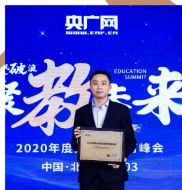
2020“乘风破浪 聚教未来”央广网教育峰会 年度口碑知名素质教育机构奖项