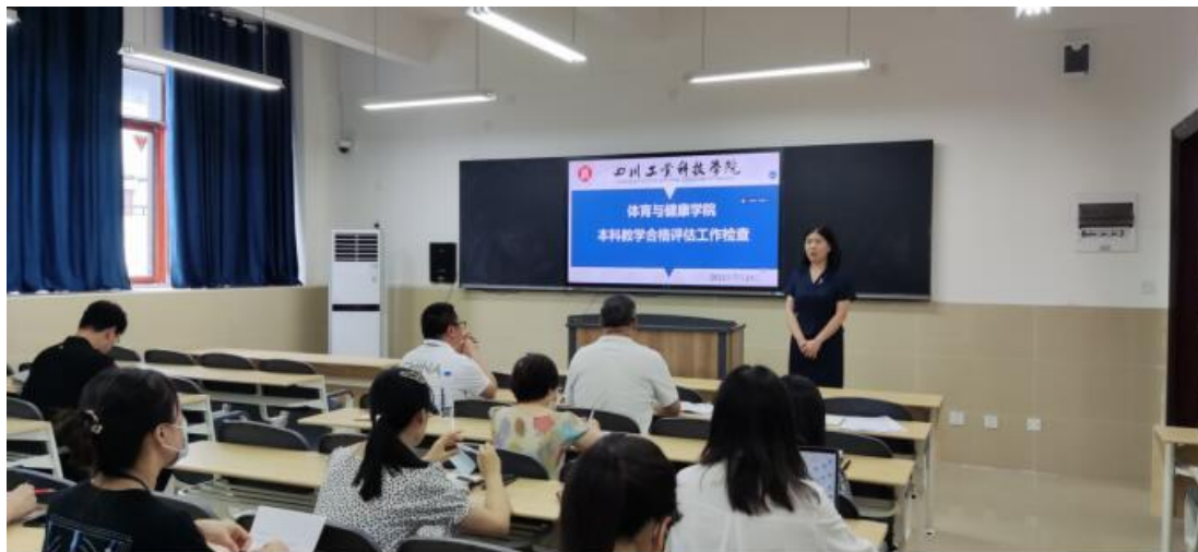
体育与健康学院开展系主任“说专业”活动

法进行了汇报。邓院长对各指标点目前的工作进展给予了肯定，对存在的问题提供了方法，指明了工作方向，理清了工作思路，对学院进一步完善评估工作起到了巨大的推动作用。