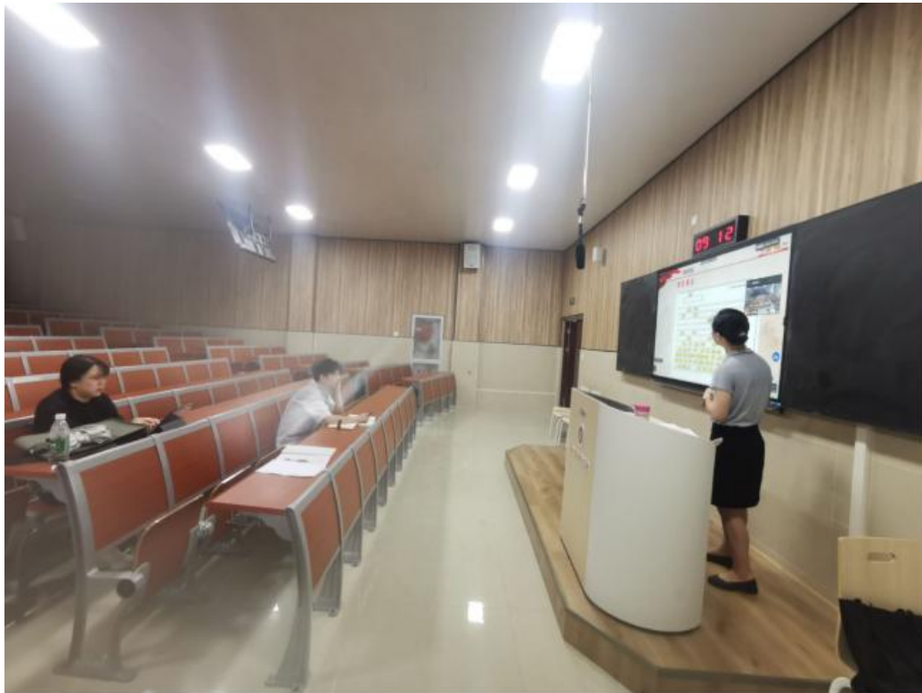
我院承办的首届思想政治工作创新论坛暨“三全育人”综合改革研讨会取得圆满成功